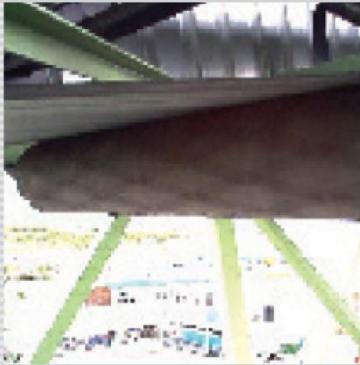
Rulmecan hihnanohjausrulla toiminnassa