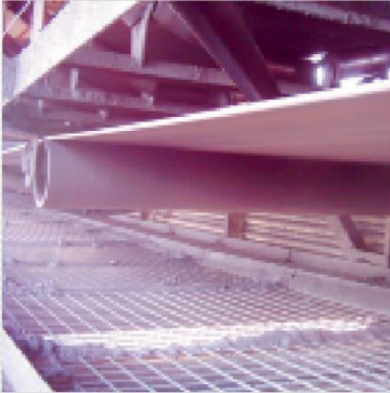
Rulmecan hihnanohjausrulla estää hihnan rikkoutumisen